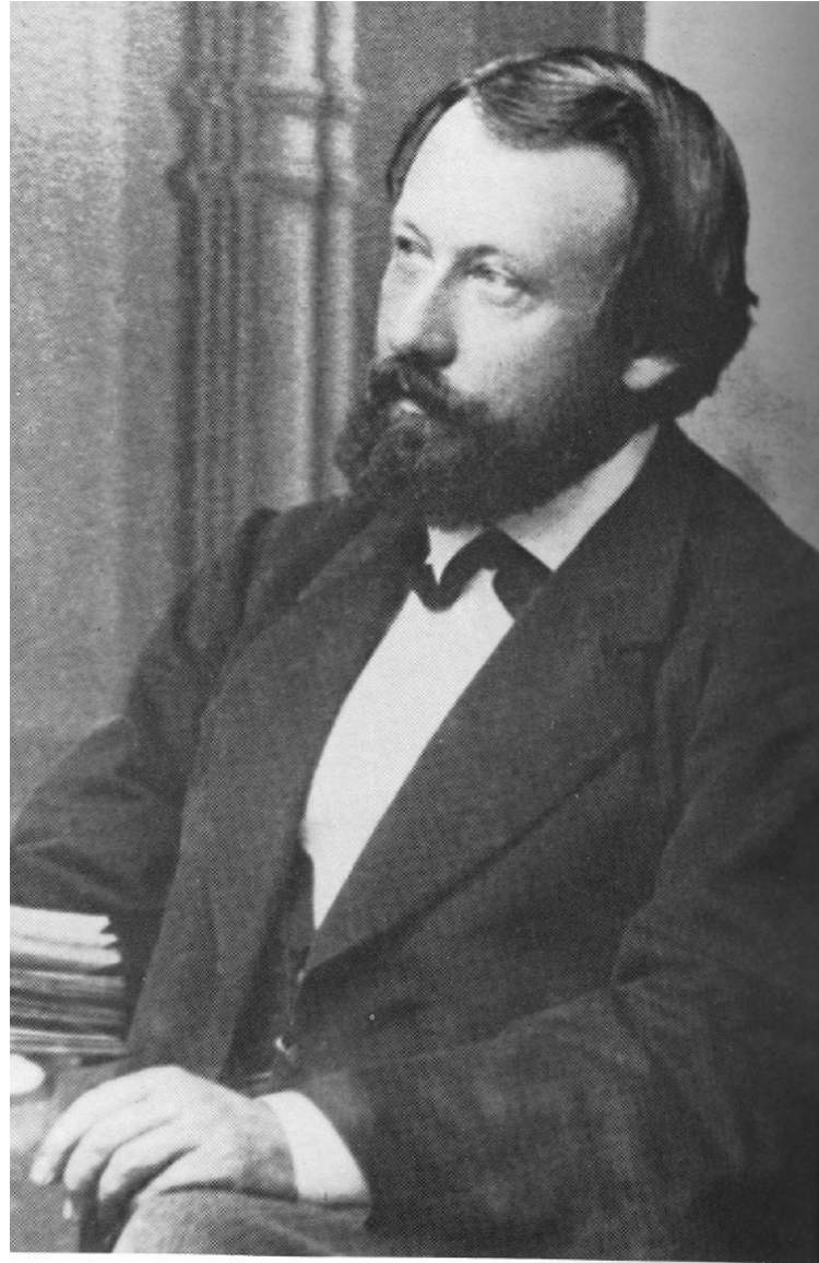
Wilhelm Dilthey (1833-1911)